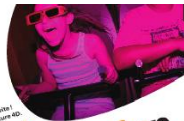
Foncez encore plus vite ! Avec Arthur, l'Aventure 4D.