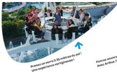
Prenez un verre à 35 mètres du sol ! Une expérience vertigineuse !

Plongez dans l'atmosphère fun, festive et familiale du Futuroscope ! Attractions captivantes, sensations extrêmes, spectacles vivants uniques, aquaféerie nocturne fascinante... Tant de choses sont à vivre ensemble ! Il y en a pour tous les goûts et tous les âges ! Et parmi toutes les nouveautés ne manquez pas L'Age de Glace , l'attraction et La Forge aux Etoiles , imaginée par le Cirque du Soleil .