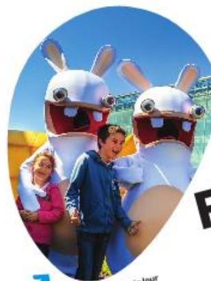
Les Lapins Crébins s'échappent de leur attraction pour venir vous rencontrer dans les allées du parc.

fun, familial, fantastique, féerique, Futuroscope !